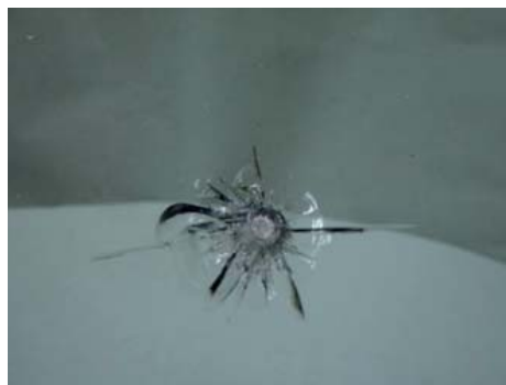
«Occhio di pernice» sul parabrezza.

Nelle auto moderne, il parabrezza è incollato alla scocca. La sua sostituzione è quindi molto dispendiosa e comporta costi non indifferenti, inclusi quelli per il vetro di ricambio. Non si potrà fare a meno di sostituire il parabrezza se è danneggiato nel campo visivo del conducente, nei margini (meno di 10 cm dal bordo), oppure se è scheggiata la lastra interna e vi sono delle infiltrazioni di acqua o sporco. Quest'intervento radicale non è peraltro necessario se si tratta di bozzi dovuti a pietrisco fino a circa 5 mm. Se si allargano a stella (vedi qui sotto), il diametro non deve superare i 3 mm. Siccome il parabrezza è comunque soggetto a logorio, una riparazione puntuale ha poco senso se il cristallo è danneggiato in più parti. Un parabrezza colpito da grosse sassate o crepato va sostituito quanto prima.