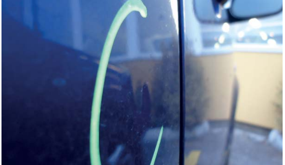
Le sportellate lasciano il segno.

Rigature o graffi sulla vernice riducono il valore dell'auto sul mercato dell'usato. I kit Spot repair consentono riparazioni circoscritte alla sola area interessata, con evidente risparmio di tempo e denaro. È ideale per rimuovere difetti poco vistosi, ad esempio su paraurti, soglie, e sotto le portiere, mentre sulle zone orizzontali quali cofano motore e/o bagagli, tetto, ecc. il metodo non si presta questo metodo non si presta che limitatamente. La parte danneggiata viene stuccata e, dopo aver dato una mano di fondo, si posa uno strato sottile di colore - peraltro miscelato ad hoc perché sia identico a quello del pezzo. Per ridare brillantezza, si sigilla con un velo di lacca trasparente. Con lo Spot Repair non si corrono rischi: se il ritocco non dovesse convincere, si potrà sempre decidere per la riverniciatura completa della parte.